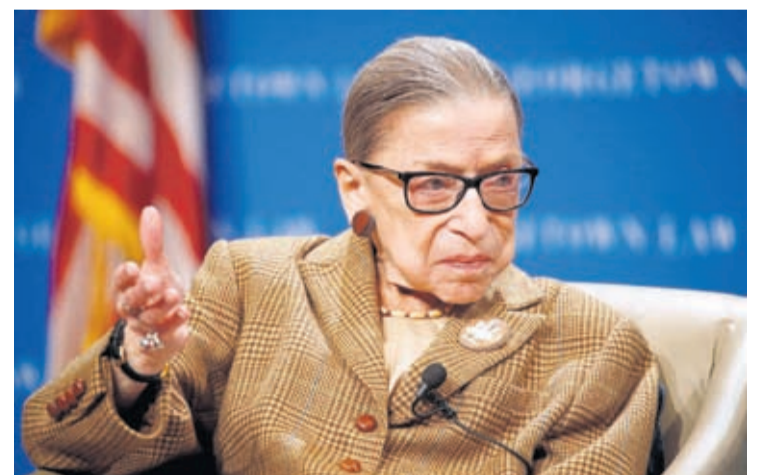
In this Feb. 10, 2020, file photo U.S. Supreme Court Associate Justice Ruth Bader Ginsburg speaks during a discussion on the 100th anniversary of the ratification of the 19th Amendment at Georgetown University Law Center in Washington.